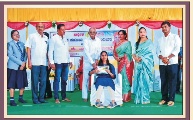
50ನೇ ವಾರ್ಷಿಕ ಮಹಾಸಭೆಯಲ್ಲಿ ಎಸ್.ಎಸ್.ಎಲ್.ಸಿ / ಪಿಯುಸಿ ವಿಭಾಗದಲ್ಲಿ ಹೆಚ್ಚು ಅಂಕಗಳಿಸಿದ ಸದಸ್ಯರ ಮಕ್ಕಳಿಗೆ ಪ್ರತಿಭಾ ಪುರಸ್ಕಾರ ಸನ್ಮಾನ ಮಾಡಿದ ಸಂದರ್ಭ