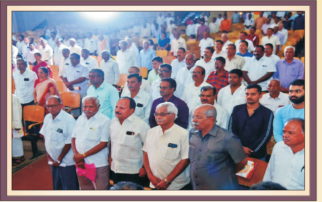
50ನೇ ವಾರ್ಷಿಕ ಮಹಾಸಭೆಯಲ್ಲಿ ಬ್ಯಾಂಕಿನ ಸದಸ್ಯರು ನಾಡಗೀತೆ ಹಾಡಿದ ಸಂದರ್ಭ